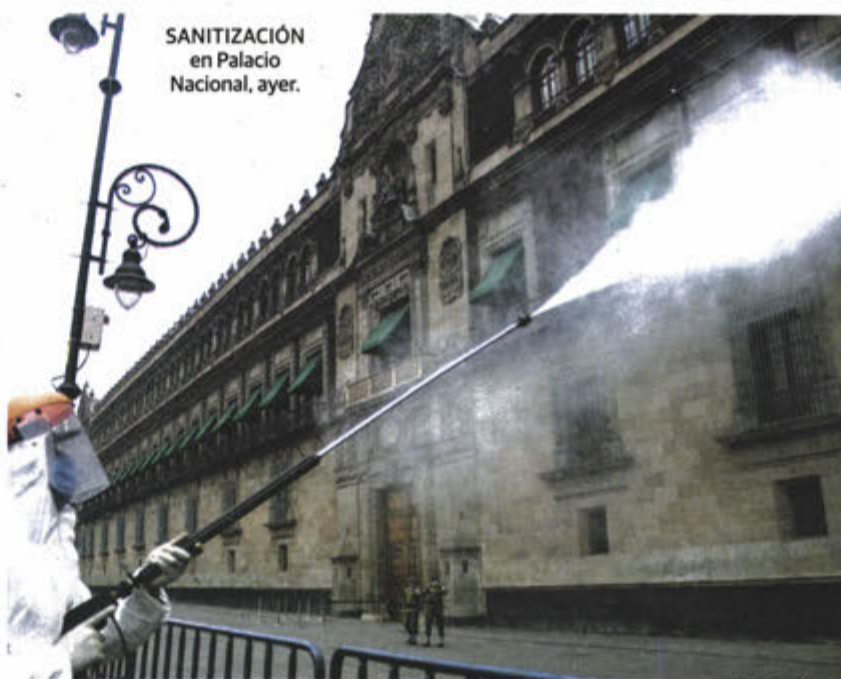
SANITIZACIÓN en Palacio Nacional, ayer.

JALISCO DEVUELVE A 6 DE LA ZMVM CON "SÍNTOMAS QUE PUDIERAN SIGNIFICAR" COVID En filtros detectan a posibles contagiados y les niegan acceso; el Presidente pide no actuar con autoritarismo. págs. 4 y 9