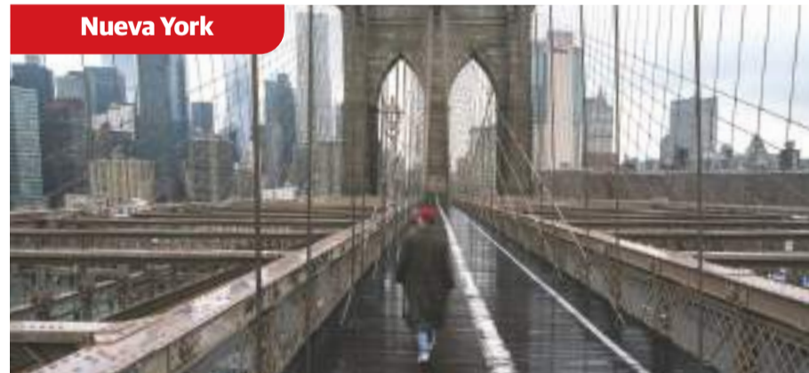
Un hombre camina sobre el puente de Brooklyn, ayer.