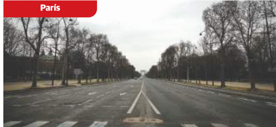
Campos Elíseos, principal avenida de París, desierta, ayer.