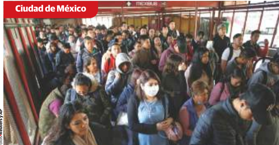
Cientos de pasajeros esperan en la estación del Metro Pantitlán, ayer.