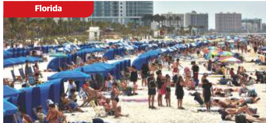
En Clearwater, bañistas abarrotan la playa, pese a que en el estado hay 216 contagiados.