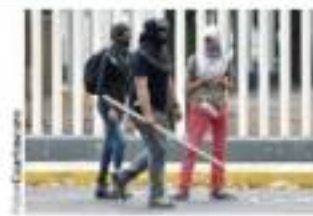
ENCAPUCHADOS, ayer, afuera del COH tomado.

Pese a barricada de maestros y trabajadores, manifestantes toman a golpes instalaciones; dejan al menos 14 lesionados. pág. 9