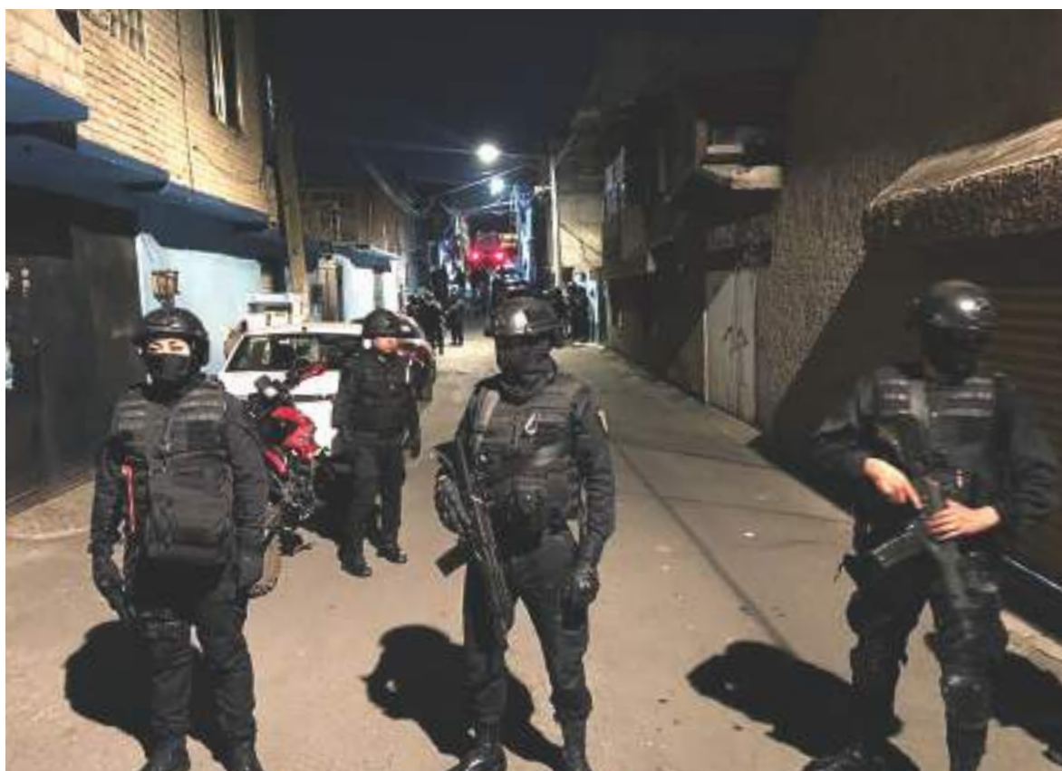
EL OPERATIVO, ayer, en la calle y casa donde ubicaron pertenencias de la niña.

Ajustan protocolo de Alerta Amber y de entrega de alumnos; sepultan a la menor entre lágrimas y reclamo de justicia.