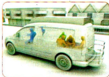
Se fueron en una camioneta que iba a trasladar a otro reo al Rubén Leñero.