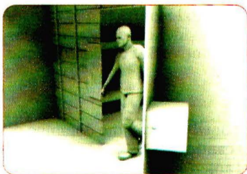
Puerta del dormitorio de los extraditables estaba abierta y sin candado.