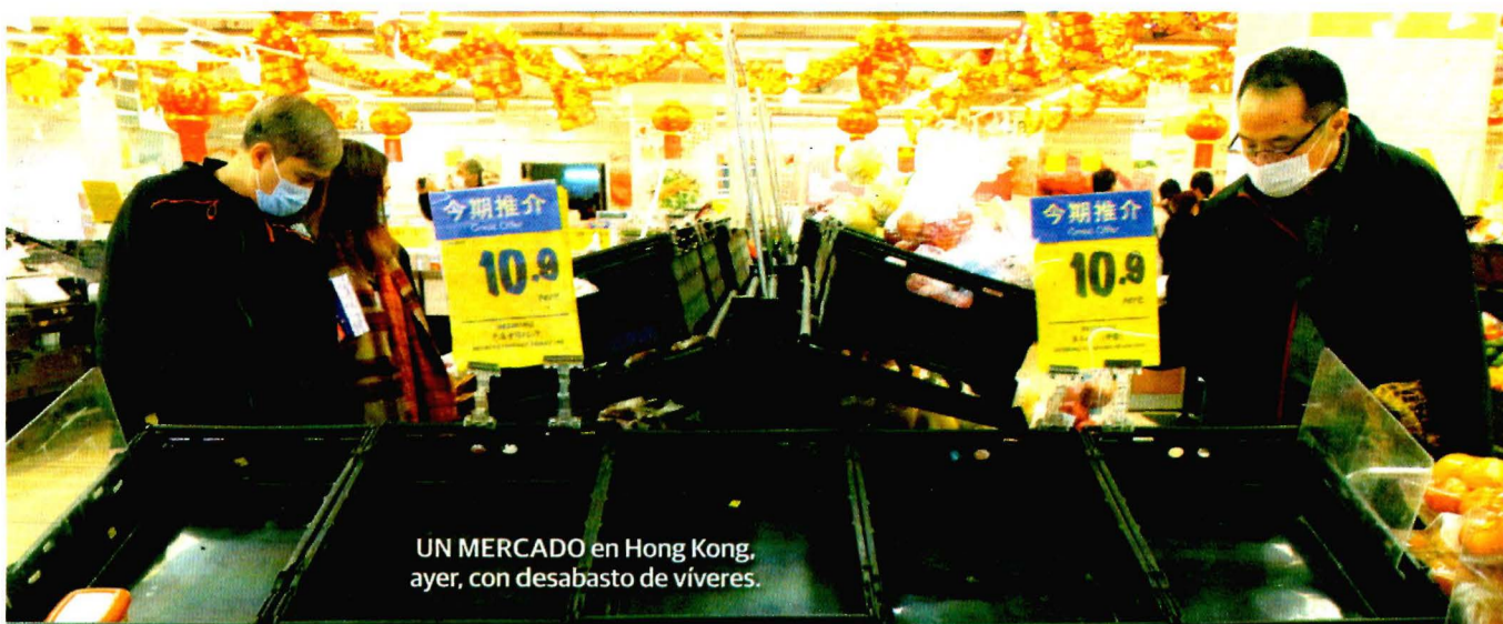
UN MERCADO en Hong Kong, ayer, con desabasto de víveres.