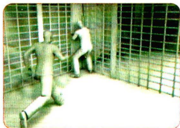
Pasaron por 5 dormitorios quitando los barrotes de seguridad.