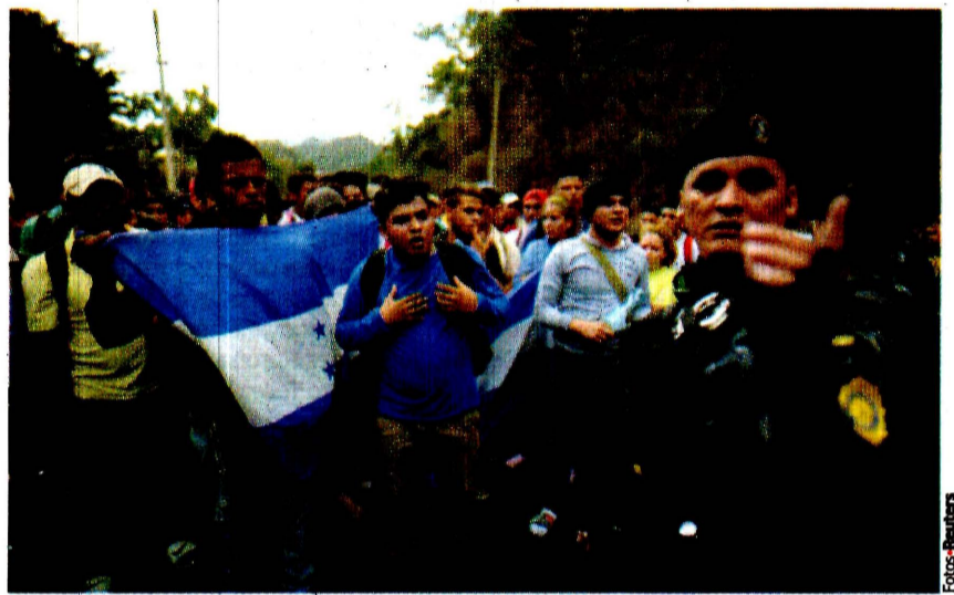
INDOCUMENTADOS hondureños, ayer, en su tránsito por Guatemala.