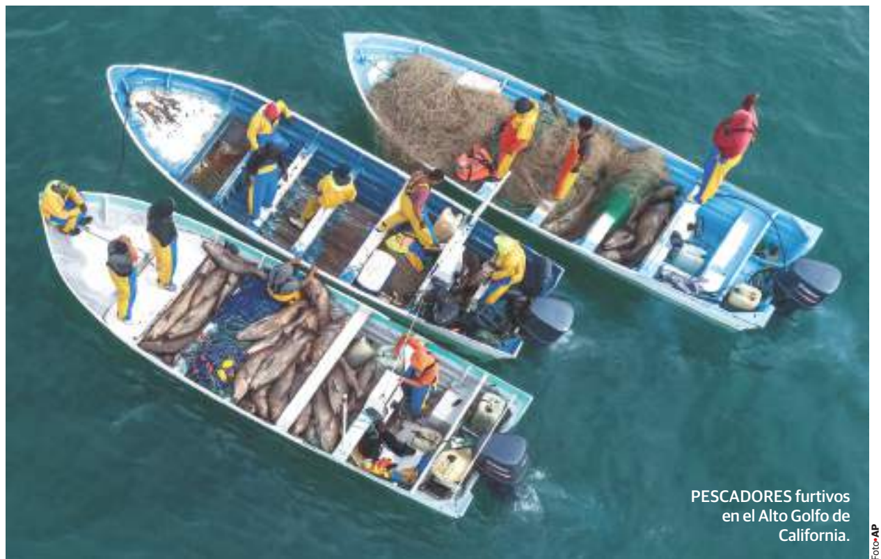
PESCADORES furtivos en el Alto Golfo de California.

Descubren ambientalistas pangas que pescan ilegalmente y a plena luz del día en San Felipe, Baja California, refugio de la vaquita marina, en peligro de extinción; capturan y quitan el buche a al menos 500 peces. pág. 7