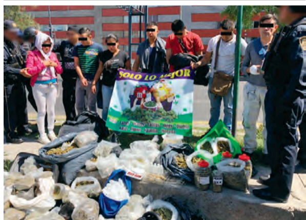
UNO DE LOS ASEGURAMIENTOS más cuantiosos, realizado el pasado viernes, de 70 kilos.

»Emitirá alertas al sector financiero y bancario sobre el riesgo que representa que realicen operaciones con el gobierno de Venezuela.