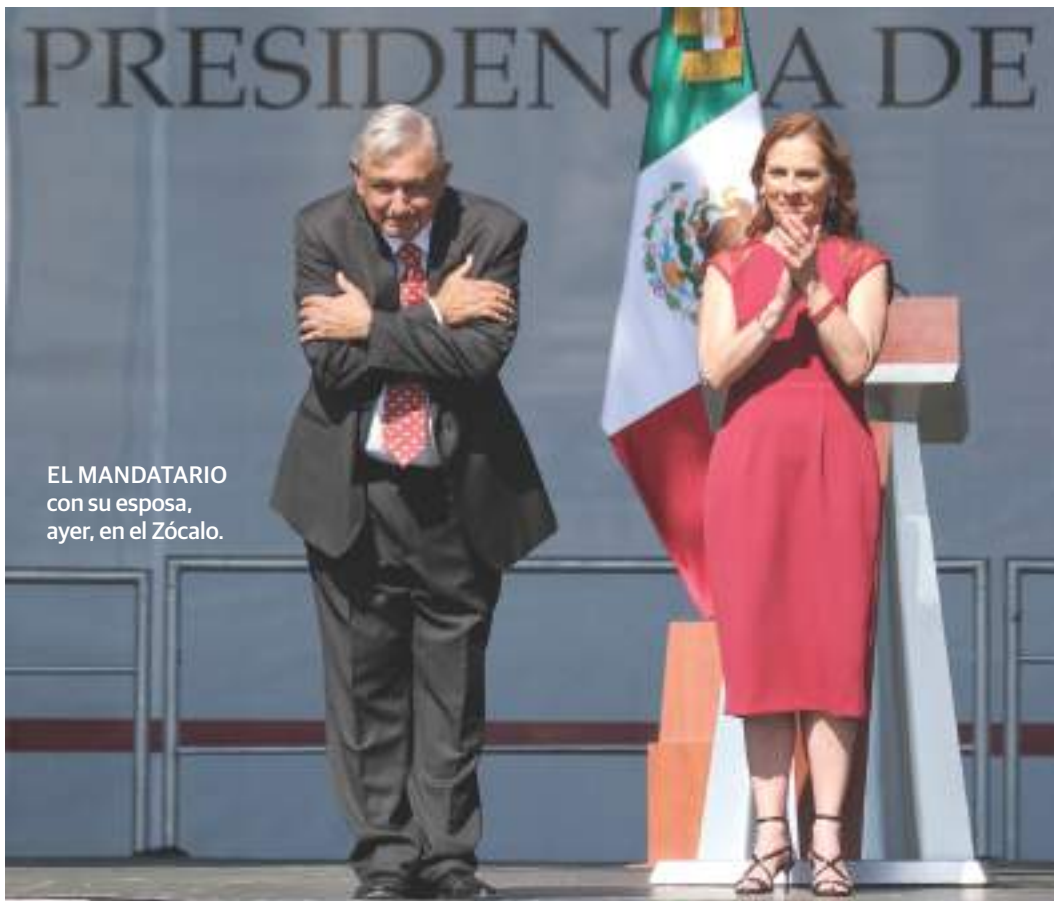
EL MANDATARIO con su esposa, ayer, en el Zócalo.

ESTRATEGIA desquiciada de seguridad no se repetirá; falta de crecimiento, pero se distribuye mejor la riqueza, sostiene pág. 3