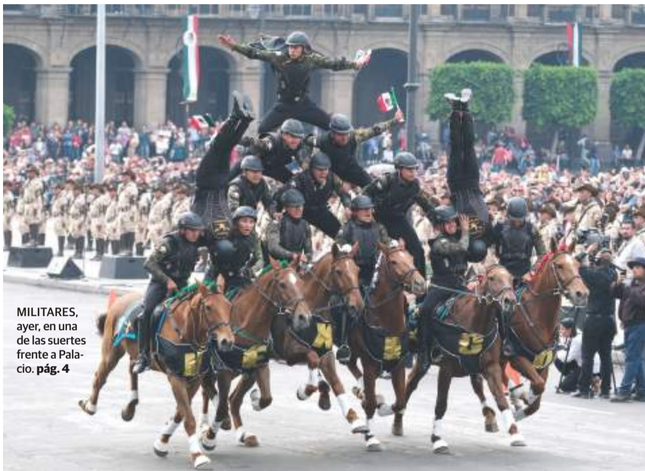
MILITARES, ayer, en una de las suertes frente a Palacio. pág. 4