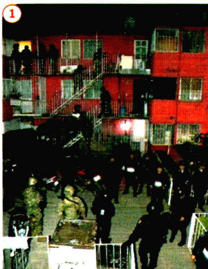
DESPLIEGUE en el exterior de la vecindad en la colonia Morelos.

En megaoperativo en vecindades, en el que participó la Marina, hallan pasadizos secretos, armas, drogas; ven colusión de funcionarios. pág. 13