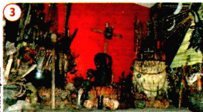
UN ALTAR satánico fue uno de los hallazgos, ayer.