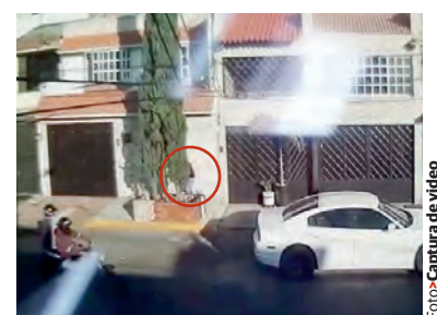
EL MANDO (círculo) logra ver a los atacantes y se protege.

Un video registra el momento del atentado.