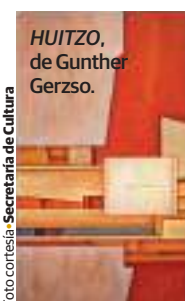
HUITZO, de Gunther Gerzso.

Inauguran muestra De lo perdido, lo que aparezca ; son pinturas de Soriano, Felguérez, Toledo... que no gustaron a Salinas. pág. 25