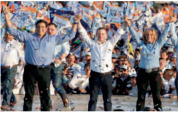
RICARDO ANAYA realizó una gira de trabajo, ayer, por Tamaulipas.

Ricardo Anaya afirma que López Obrador tiene postura cambiante con la IP, al llamarla minoría rapaz y luego ofrecer amor y paz. pág. 5