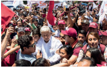
ANDRÉS MANUEL LÓPEZ OBRADOR, ayer, en Tula, Hidalgo.

El morenista asegura que el candidato del PRI ya alcanzó al del Frente, quien "no levanta"; dice que él sigue arriba por 25 puntos. pág. 6