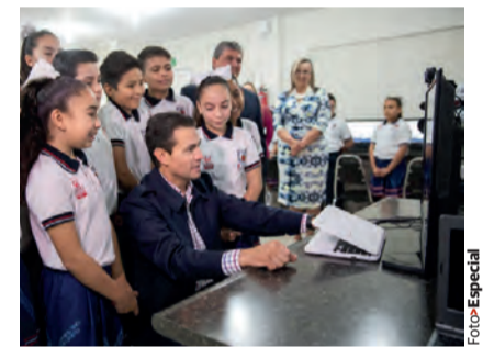
EL MANDATARIO cumplió ayer su compromiso de visitar un plantel.

Alias: El Gerardón Acusaciones: autor intelectual del homicidio del exgobernador de Colima. Presunto líder de un grupo delictivo en esa entidad. Traficante de drogas sintéticas, marihuana y cocaína en Colima y de México a EU. Recompensa: Ofrecían $10 millones por él.