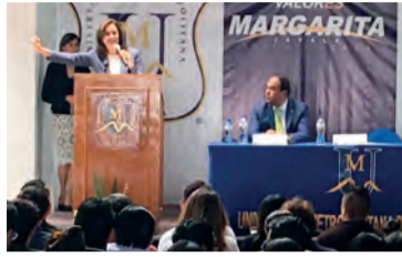
MARGARITA ZAVALA se reunió con universitarios en Tlaxcala.

La independiente acusa a AMLO del clima de confrontación al despreciar a los otros; pide recordar que "todos somos mexicanos". pág. 5