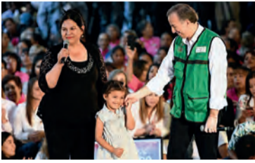
JOSÉ ANTONIO MEADE, ayer, con mujeres en Chihuahua.

El abanderado del PRI promete extender y mejorar servicios de estancias infantiles del IMSS, ISSSTE y Sedesol. pág. 4