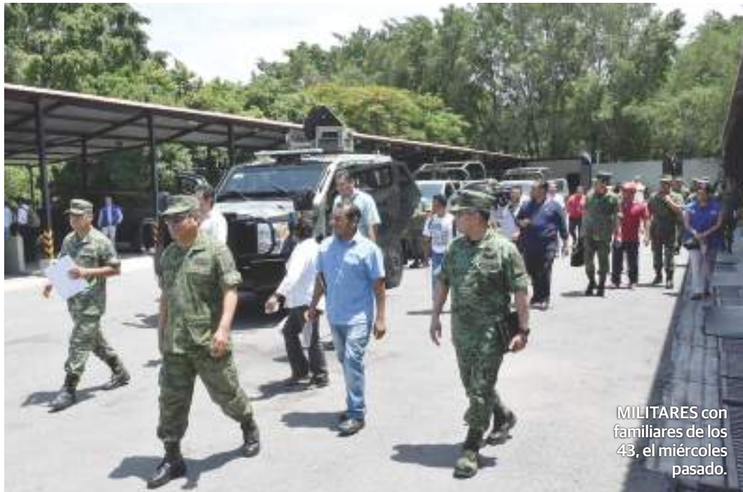
MILITARES con familiares de los 43, el miércoles pasado.

• Ponen lupa a altos funcionarios tras denuncias de CNDH, afirma el jefe de la oficina especial para Iguala