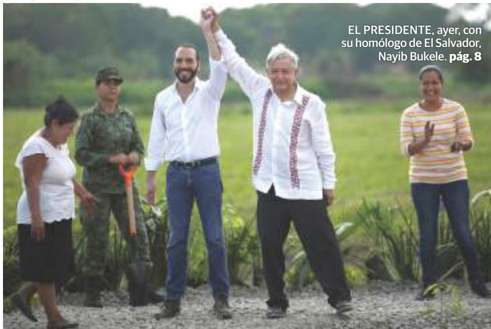
EL PRESIDENTE, ayer, con su homólogo de El Salvador, Nayib Bukele. pág. 8

Va plan para Centroamérica con 30 mdd a El Salvador