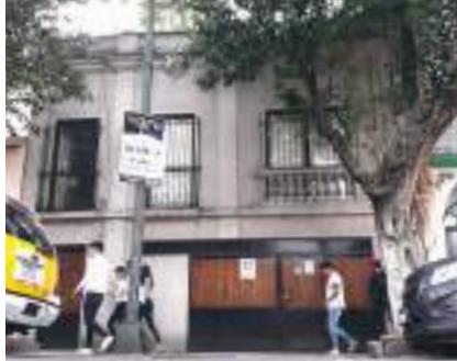
FACHADA de la casa de la artista, en la colonia Roma, ayer.