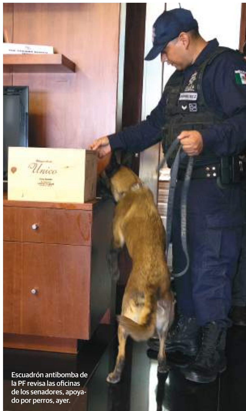
Escuadrón antibomba de la PF revisa las oficinas de los senadores, apoyado por perros, ayer.