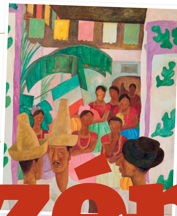
The Rivals Autor: Diego Rivera Precio para iniciar puja: 7 mdd

» LA CASA CHRISTIE'S vende mil 600 lotes, cuyo beneficio será para 12 instituciones; es el conjunto de obras más valioso que ha salido al mercado; prevén que la colección supere los 500 mdd pág. 27