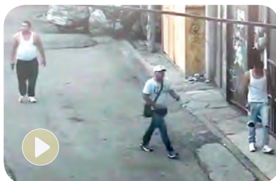
En plena calle tres sujetos preparan sus armas para un ataque en Iztapalapa.

Delinquentes ubicados en calles de la colonia Puente Blanco: