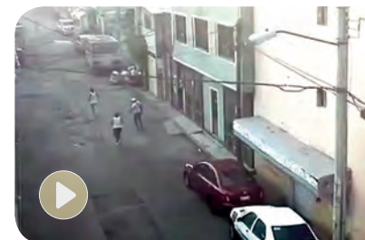
Después de 15 segundos de disparos huyen por donde llegaron.