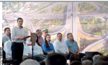
EL MANDATARIO, ayer, en Tabasco.

» El Presidente entrega obras de infraestructura carretera e hidráulica; inaugura libramiento de 24 kilómetros; ofrece mantener financiamiento a las micro, pequeñas y medianas empresas y que Pemex invierta en la entidad pág. 10