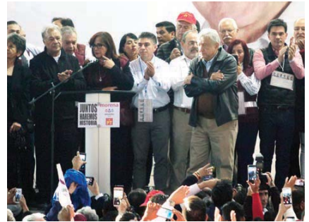
ANDRÉS MANUEL López Obrador, ayer, en Nuevo León.

El morenista encabeza mitin en Monterrey; pide a sus militantes y a los de PES y PT evitar confrontaciones pág. 7