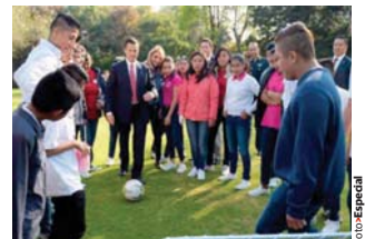
EL MANDATARIO, ayer, en Los Pinos.

» Niños de casas-hogar fueron recibidos en Los Pinos; la primera dama preside Consejo del organismo pág. 8