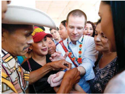
RICARDO ANAYA, ayer, en un recorrido en Nayarit.

El panista asegura que se usó de mala fe información que dio al INE; lo acompaña a Nayarit Xóchitl Gálvez pág. 6