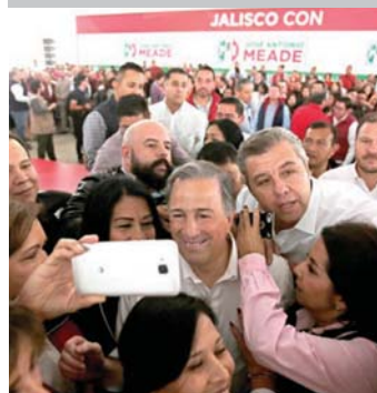
En Jalisco, ante miles de militantes, defiende la Ley de Seguridad Interior.