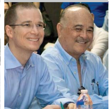
En Baja California el panista agradece apoyo de Ernesto Ruffo (der.), quien se baja de la contienda.