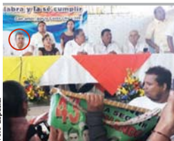
ÁNGEL AGUIRRE (círculo), exgobernador de Guerrero, ayer.