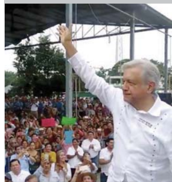
En Tabasco califica de "alcahuete" al INE por fiscalizar sus gastos de precampaña.