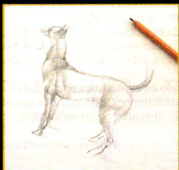
Boceto que dio origen a la escultura.

El artista presenta en Zona Maco el viaje por un mar de azogue en una barcaza habitada por tres perros xoloitzcuintles en diferentes posiciones, los cuales sortean el vacío del tiempo. pág. 22