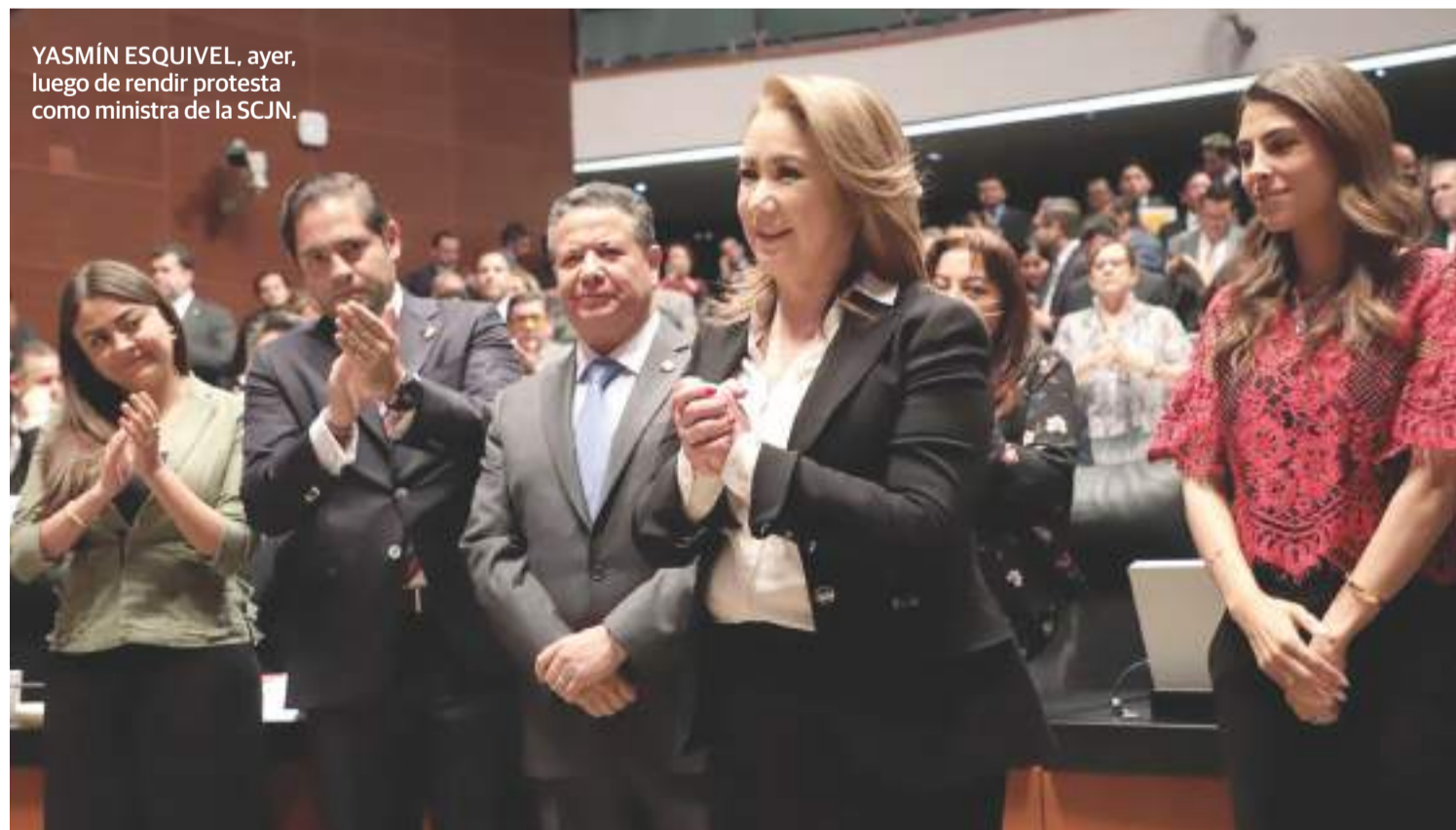
YASMÍN ESQUIVEL, ayer, luego de rendir protesta como ministra de la SCJN.