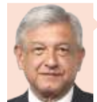
Andrés Manuel López Obrador Presidente de México

»El mandatario afirma que interpondrá una queja; no se encubrirá a quienes trabajan para la delincuencia, dice; juzgador responde que no es "mandadero ni escribano" pág. 7