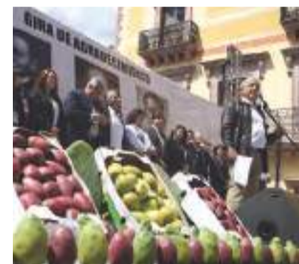
ANDRÉS MANUEL López Obrador, ayer, en un mitin en Zacatecas.

» Chocan iniciativas de profes y legisladores; se zafa Sección 9 de diputados de Morena-CNTE pág. 3