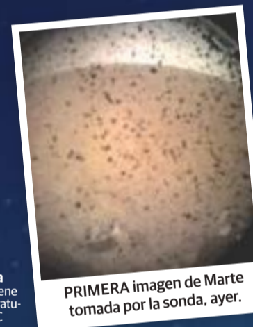
PRIMERA imagen de Marte tomada por la sonda, ayer.

Caída hipersónica Su escudo térmico tiene que soportar temperaturas de hasta 1,500 °C