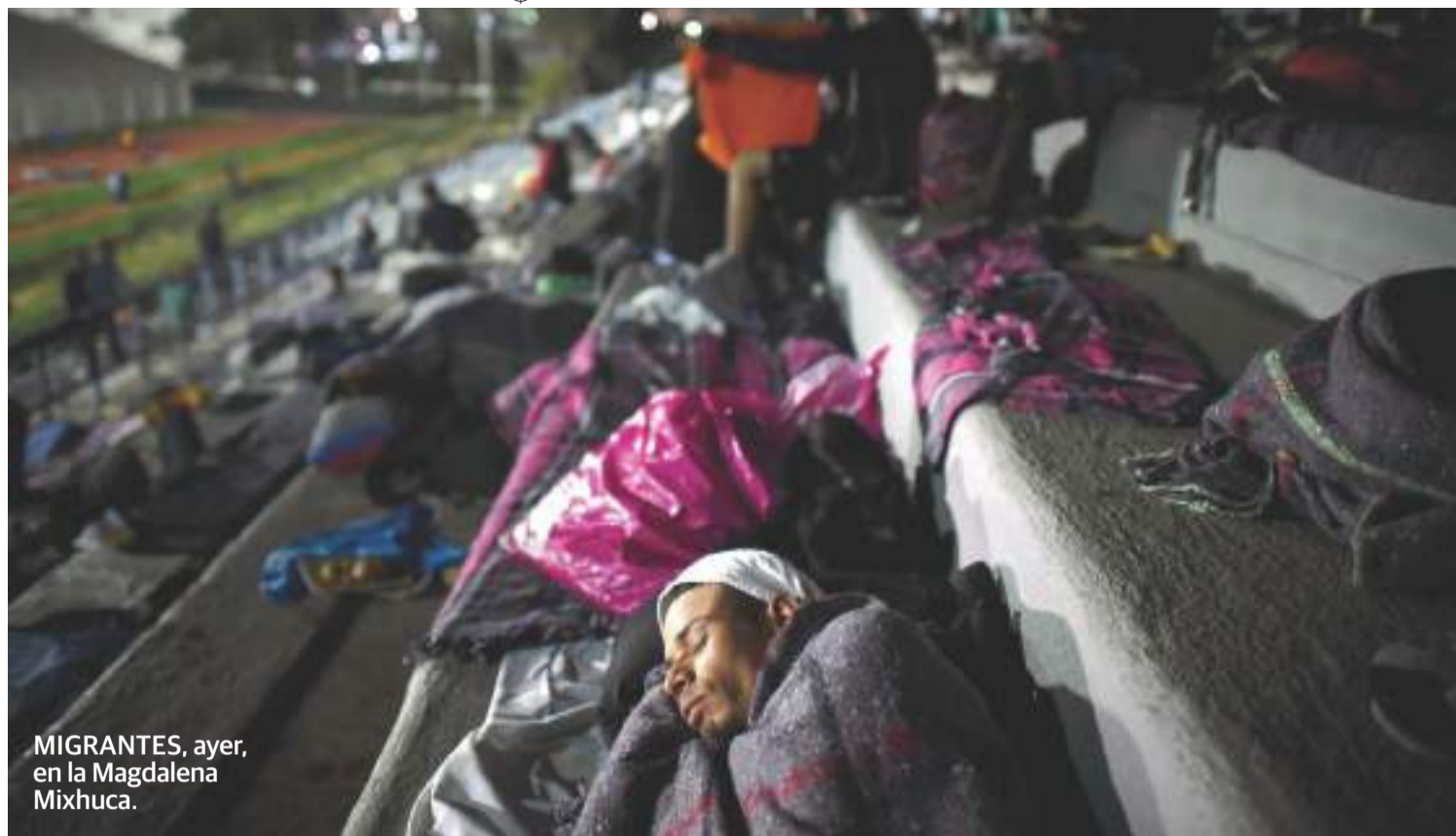
MIGRANTES, ayer, en la Magdalena Mixhuca.

Del primer éxodo vienen contingentes en Puebla y Veracruz; el segundo está en Arriaga y los dos restantes en Tapachula, Chiapas. págs. 4 y 5