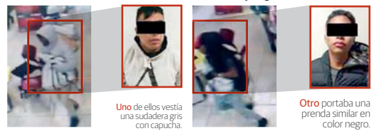
Uno de ellos vestía una sudadera gris con capucha.

Imitadores de la banda del mazo detenidos y luego liberados.