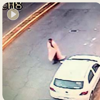
El menor va por la carpeta asfáltica y arrastra una cobija a las 18:20 horas del domingo.