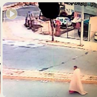
La cámara lo captó en el bulevar de los Álamos, en Melchor Ocampo, en el Edomex.