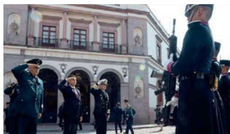
EL PRESIDENTE (centro), ayer, en el Teatro de la República, en Querétaro.

Ernesto Cordero , presidente del Senado, advierte que décadas de avances se pueden perder en sólo unos meses de irresponsabilidad. pág. 10