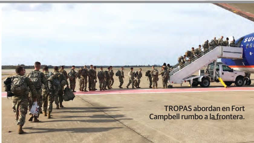
TROPAS abordan en Fort Campbell rumbo a la frontera.

La CNTE ofrece a primera marcha camiones para llegar a la CDMX; ya son 3 aquí y viene otra. pág. 10