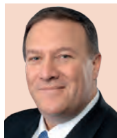
Mike Pompeo Secretario de Estado