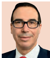
Steven Mnuchin Secretario del Tesoro