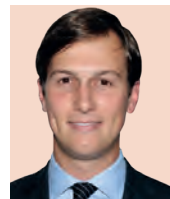
Jared Kushner Asesor de la Casa Blanca