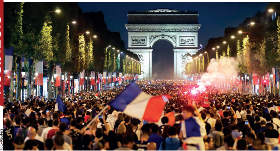
MILES DE FRANCESES festejaron en grande, ayer, en Campos Elíseos, el triunfo de su selección.