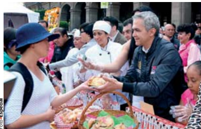
MANCERA entregó pan de muerto, ayer, en el Zócalo.

EL JEFE de Gobierno afirma que participará en la contienda por la candidatura al 2018 si existen las condiciones, y con la inclusión de la sociedad