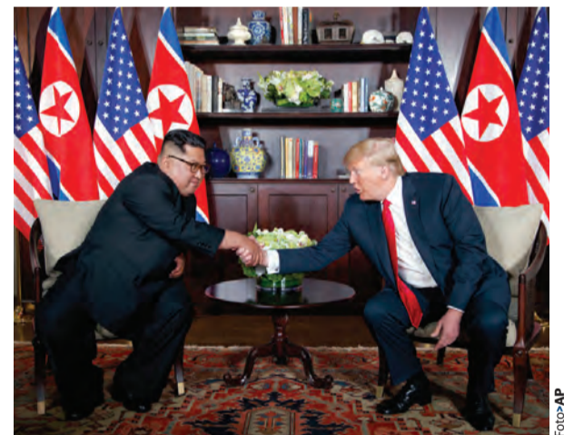
KIM JONG-UN y Donald Trump, ayer, en Singapur.