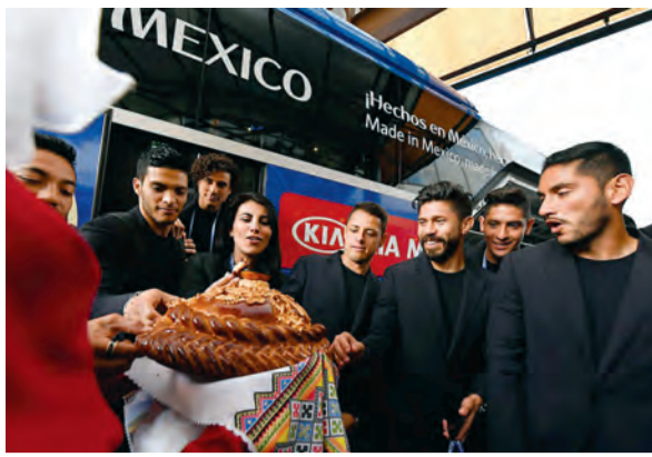
(DE IZQ. A DER.) Fabián, Jiménez, Ochoa, Chicharito, Peralta, Álvarez y Corona, ayer, a su llegada a Moscú.