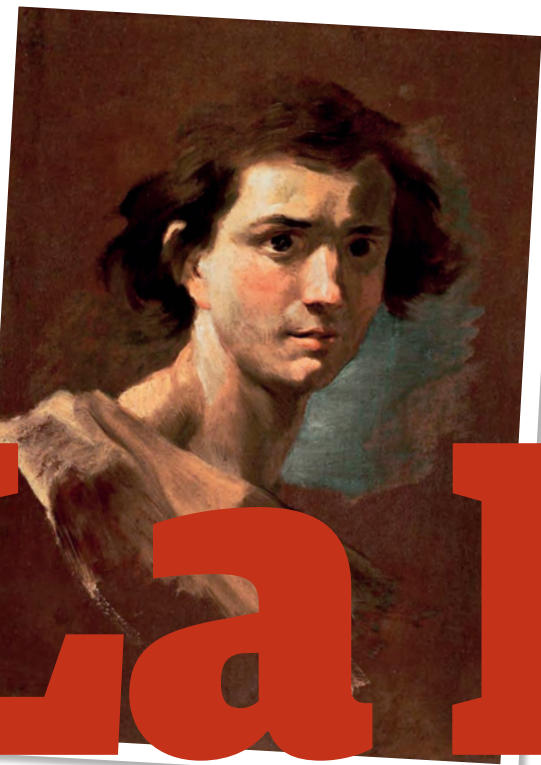
Retrato de joven Autor: Bernini