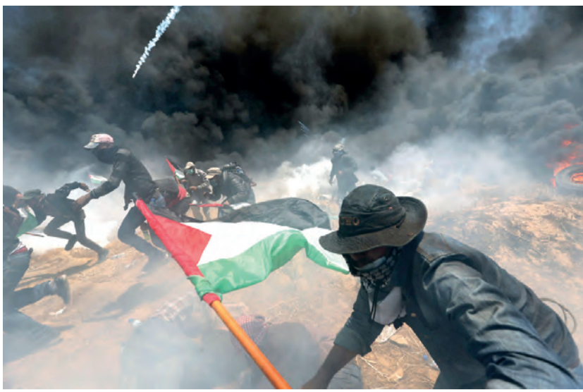
EN LAS PROTESTAS de ayer, en la Franja de Gaza participaron al menos 40 mil personas.