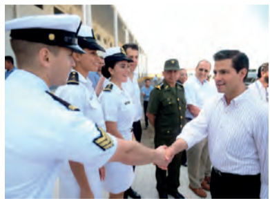
EL MANDATARIO, ayer, en Veracruz.

El Presidente asegura que si no hay Estado de derecho, empresarios no arriesgan y no se generan empleos ni infraestructura. pág. 9