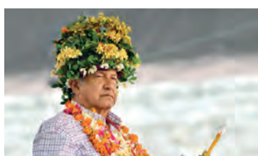
ANDRÉS MANUEL López Obrador, ayer, en un mitin en Veracruz.

El abanderado del tricolor afirma que el objetivo es evitar que caigan en pobreza; también, ampliar la inclusión financiera. pág. 6