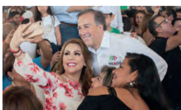
JOSÉ ANTONIO Meade, ayer, con mamás, en Sinaloa.