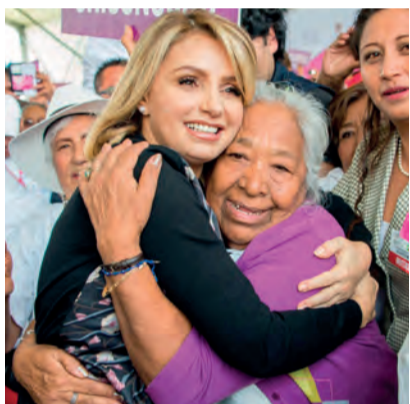
ANGÉLICA Rivera de Peña.