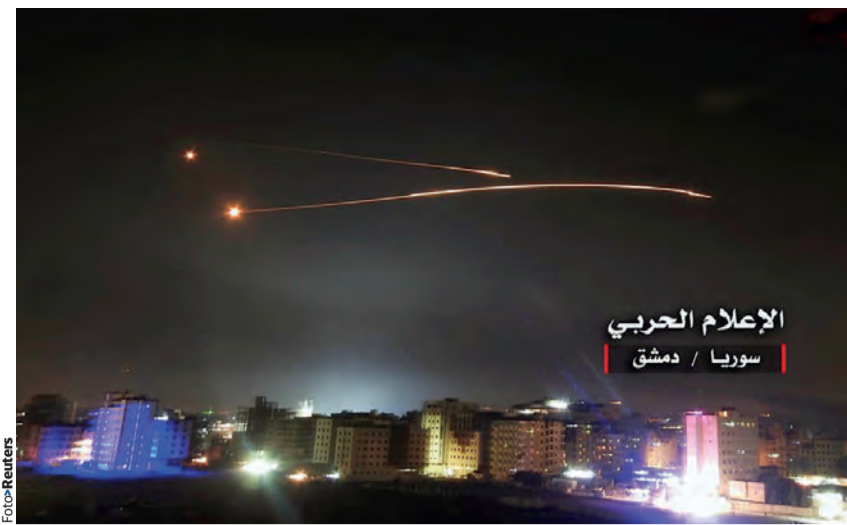
MISILES de Israel vuelan sobre Damasco, la noche del miércoles.

» Una agresión de Teherán con misiles a los Altos del Golán, territorio bajo dominio israelí desde 1967, desató ayer una acción de represalia del Ejército hebreo sobre objetivos militares iraníes en Siria; en el nuevo escenario de Medio Oriente, Alemania y Francia señalan que ya no pueden confiar en EU, luego de que Trump puso fin al acuerdo que mantenía la estabilidad en la región págs. 28 y 29