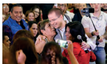
RICARDO ANAYA, ayer, en celebración del 10 de mayo en CDMX.

Cuestiona que Lorenzo Córdova haya planteado la posibilidad de una elección cerrada; "mándenle las encuestas", pide. pág. 5