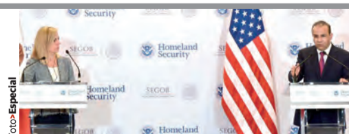
KIRSTJEN NIELSEN y Alfonso Navarrete Prida, ayer.

» El secretario de Gobernación, Alfonso Navarrete, y la secretaria de Seguridad Nacional de Estados Unidos, Kirstjen Nielsen, tratan asuntos de migración y drogas; se comprometen a trabajar para disminuir índices de violencia entre ambos países; el titular de Segob expone que lo fundamental es la protección de los derechos humanos pág. 10