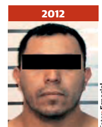
2012 Es detenido por el delito de robo en pandilla.