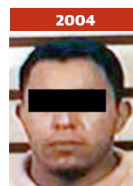
2004 Cae en el Reclusorio Norte por delitos patrimoniales.