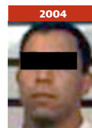
2004 Regresa meses después al penal por el mismo delito.