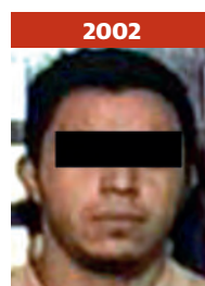
2002 Llega al Reclusorio Sur por el delito de robo calificado.