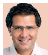
Armando Ríos Piter Aspirante independiente

"No debíamos ser los candidatos los que exhortemos a debatir... la ciudadanía debería ser la que nos moviera a contrastarnos, a rendir cuentas" pág. 4