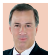
José Antonio Meade Candidato del PRI

"Quiero retar a un debate a Andrés Manuel López Obrador. Vamos a ver si el señor tiene las ideas, el valor y los pantalones para enfrentarnos en un debate" pág. 3