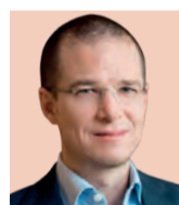
Ricardo Anaya Candidato del Frente

ACONSEJA intercambio entre el aspirante del PRI y el del Frente para ver todo lo que tienen pendiente; critica "malas formas" de retarlo