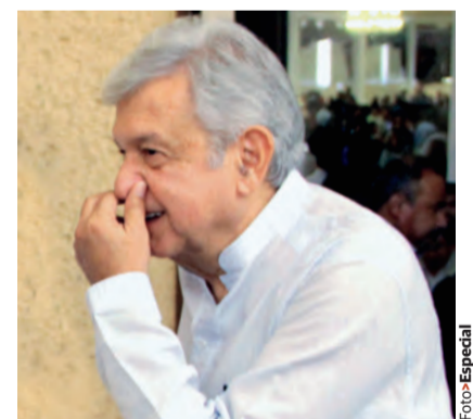
Andrés Manuel López Obrador Candidato de Morena

"En los debates es importante ver cómo reaccionan (los candidatos). Cuando tú te pones enfrente y de repente le picas las costillas ves reacciones en su liderazgo" pág. 3