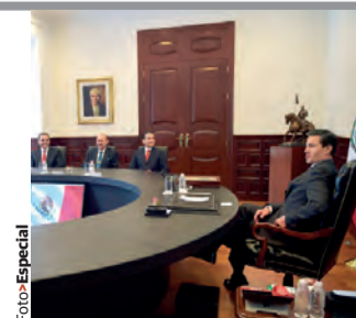
EL PRESIDENTE, ayer, con el grupo empresarial.

» El mandatario se reúne con integrantes del grupo Nacer Global, el cual lanzará en el mercado bursátil el primer fideicomiso de inversión en bienes raíces, conocido como Fibra, que apoyará planes inmobiliarios a favor de la educación pág. 8