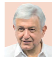
Andrés Manuel López Obrador Candidato de Morena "Celebro que el Presidente haya declarado eso (que no va a intervenir en comicios), le doy el beneficio de la duda... si lo cumple es un voto a su favor"