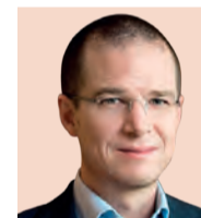
Ricardo Anaya Candidato del Frente "Deje de acosar a los opositores a través de la PGR y permita que sea el pueblo de México el que con absoluta libertad decida quién será el próximo presidente"