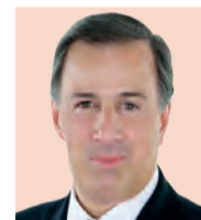
José Antonio Meade Candidato del PRI "Debemos estar dispuestos a cortar el cordón umbilical entre el Ejecutivo y ministerios públicos"

Las democracias , a diferencia de las revoluciones, son tediosas o poco espectaculares. Pero a veces, como ahora en México, requieren de una sacudida simbólica que ponga a los liderazgos y las instituciones en función de la gente. Un desenlace electoral que agrande más la distancia entre el orden institucional y la ciudadanía del país puede ser desastroso para el futuro inmediato de la democracia mexicana y sus relaciones con Estados Unidos y América Latina. pág. 6