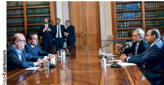
GRACO RAMÍREZ y Silvano Aureoles (izq.), con Miguel Mancera y Alfonso Navarrete (der.), ayer.

» Alfonso Navarrete Prida recibió a los mandatarios Silvano Aureoles, de Michoacán; Graco Ramírez, de Morelos, y al Jefe de Gobierno de la Ciudad de México, Miguel Mancera; establecerán mesas con la Comisión Nacional de Seguridad; el funcionario se reunió también con el chiapaneco Manuel Velasco pág. 5