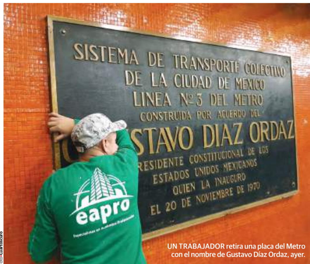
UN TRABAJADOR retira una placa del Metro con el nombre de Gustavo Díaz Ordaz, ayer.

[ Suplemento especial en páginas centrales ]