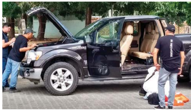
Galindo viajaba en una camioneta 4x4 Ford Lobo negra 2013

» Interceptan a legislador y le disparan cuando viajaba en su camioneta; la coalición Por México al Frente exige esclarecer los hechos y castigar con rigor a responsables; demanda reforzar seguridad en entidades con comicios pág. 11