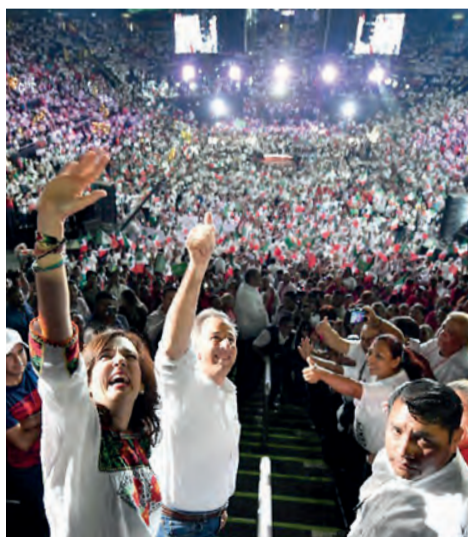
JOSÉ ANTONIO MEADE, ayer, en el acto realizado en la Arena Monterrey.

» Convocan a miles: Meade en NL y Coahuila; AMLO en Chiapas, Tabasco y CDMX; Anaya en Guanajuato; El Bronco apuesta al público digital págs. 6, 7 y 8