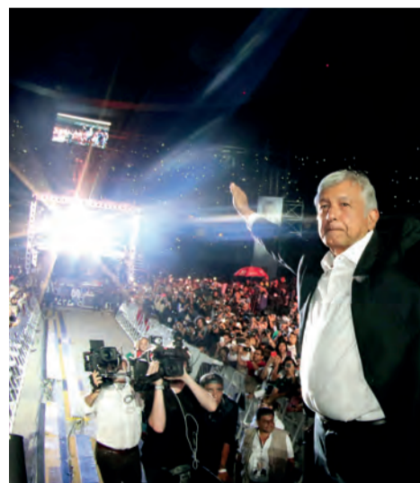
ANDRÉS MANUEL LÓPEZ OBRADOR, ayer, en el Estadio Azteca.