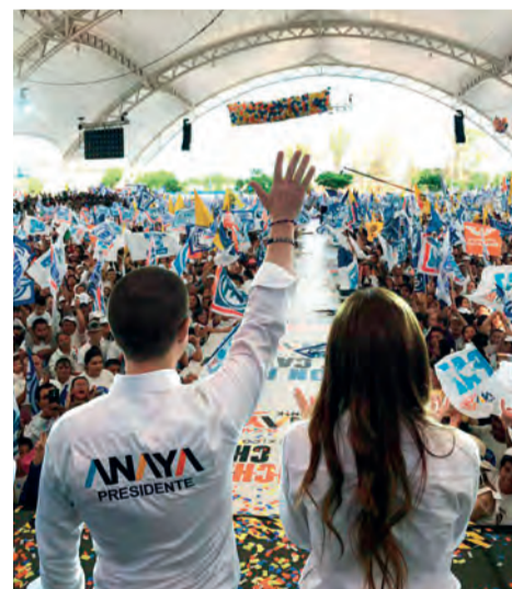
RICARDO ANAYA, en el recinto ferial en León, Guanajuato, ayer.