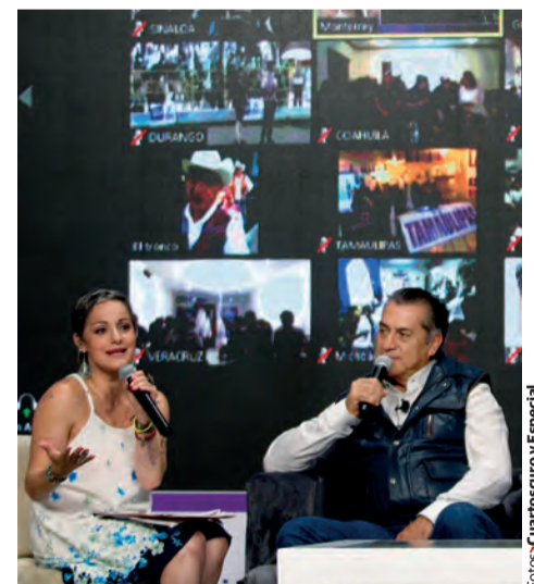
JAIME RODRÍGUEZ CALDERÓN, ayer, en la transmisión de su charla digital.