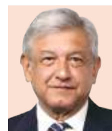
Andrés Manuel López Obrador Presidente de México

» AMLO acusa que grupos mezquinos crearon un ambiente en redes para manchar su administración; por eso no acudió a funerales de Alonso y Moreno Valle