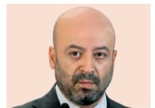
Renato Sales Comisionado Nacional de Seguridad "No hay una petición, al contrario, el Rector ha mencionado que no se vincule ninguna institución policial al interior... la UNAM no es un feudo, no viene a ser un lugar aislado del derecho y de la investigación ministerial y policial". pág. 14