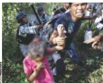
MIGRANTES asustados, ayer en Chiapas, cuando llegan elementos de la GN.

ADVIERTE que Gobierno debe hallar equilibrio entre reconocer derechos y seguridad, ante la presión de Trump para frenar el flujo pág. 4