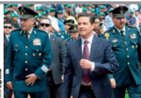
EL MANDATARIO, en las instalaciones del Estadio Sedena, que inauguró ayer.

En la celebración del Día del Ejército, el Presidente anuncia incremento salarial para soldados, pilotos y marinos; en este sexenio se adquirieron seis mil vehículos, 100 aviones, 40 helicópteros... pág. 10