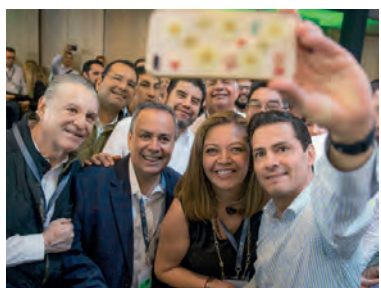
EL MANDATARIO, ayer, en Jalisco en un encuentro con productores.

»Las exportaciones en el sexenio alcanzan 150 mmdd, afirma el Presidente Enrique Peña; es el mejor momento del campo en la historia, señala; destaca inserción en el mercado mundial y superávit pág. 3