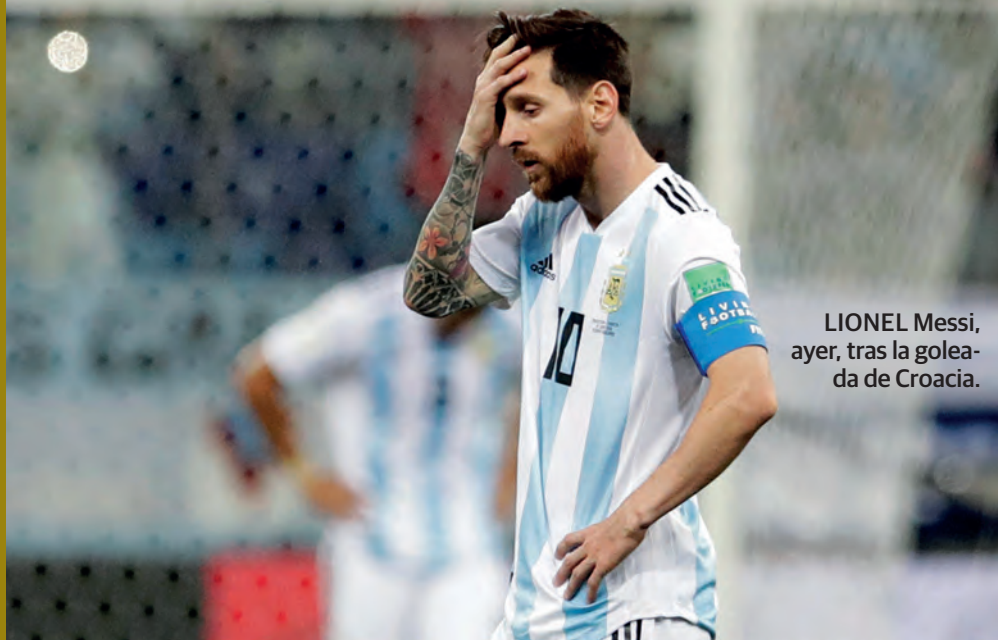
LIONEL Messi, ayer, tras la goleada de Croacia.

[Suplemento Especial en páginas centrales]