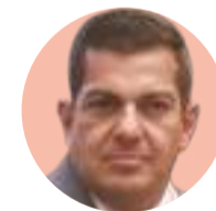
Ricardo Peralta Subsecretario de Gobernación

• El subsecretario de Segob rechaza que este Gobierno genere conflictos; asegura a La Razón que cada hora resuelven un problema de administraciones pasadas como los del SME, ferrocarrileros...; en 6 meses, mil 800 atenciones pág. 3